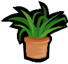
Plantas de interior

O Decreto-Lei nº 101/2009, que entra em vigor no próximo dia 10 de Agosto de 2009, regula o uso não profissional de produtos fitofarmacêuticos em ambiente doméstico, estabelecendo condições para a sua venda e aplicação.